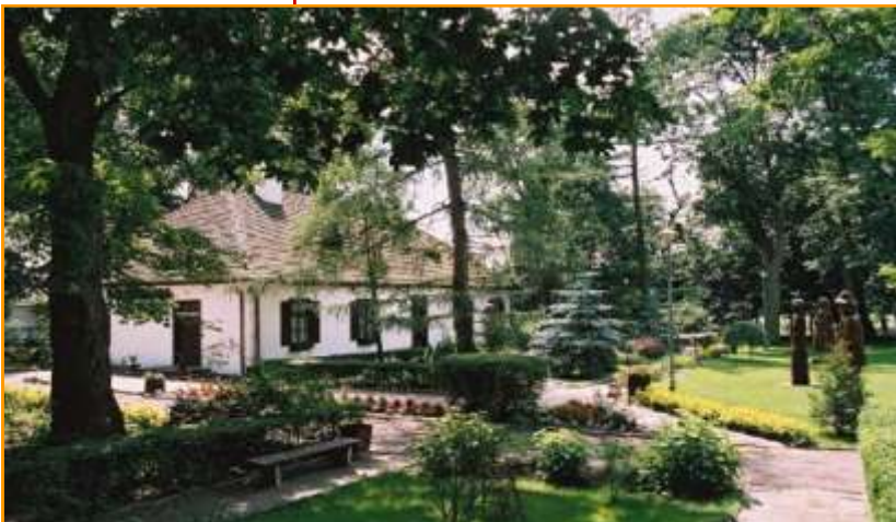
Wola Okrzejska — miejsce urodzin Henryka Sienkiewicza

Zmarł 15 XI 1916 roku w Vevey. Jego prochy osiem lat później sprowadzono do Warszawy, a dzień ich złożenia w krypcie katedry św. Jana stał się świętem narodowym.